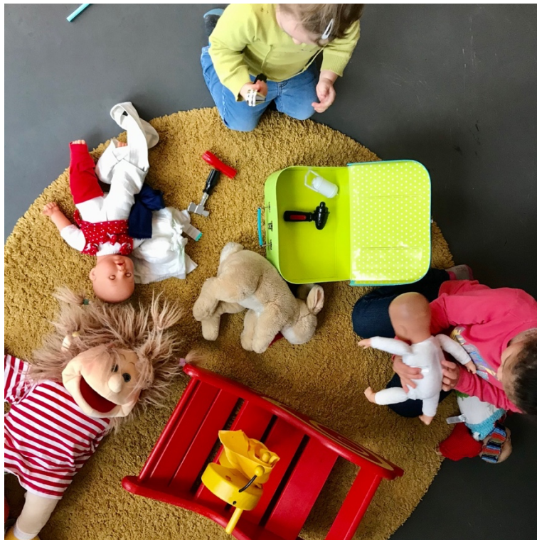
Abbildung 1: Spiel mit Arztkoffer, Spielgruppe Im Neuhof